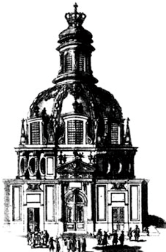
“Theatrum Anatomicum in History and Today”, Gerst-Horst Schumacher