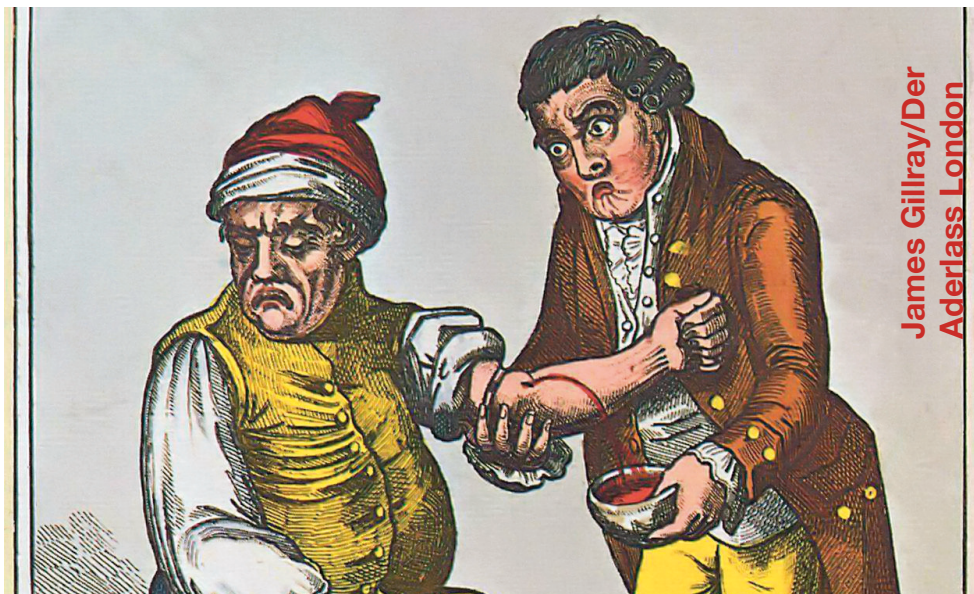
James Gillray/Der Aderlass London